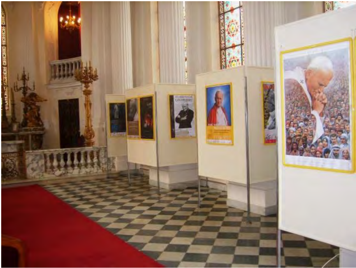
Muzeum Zamojskich Kozłówka ( kaplica palacowa).