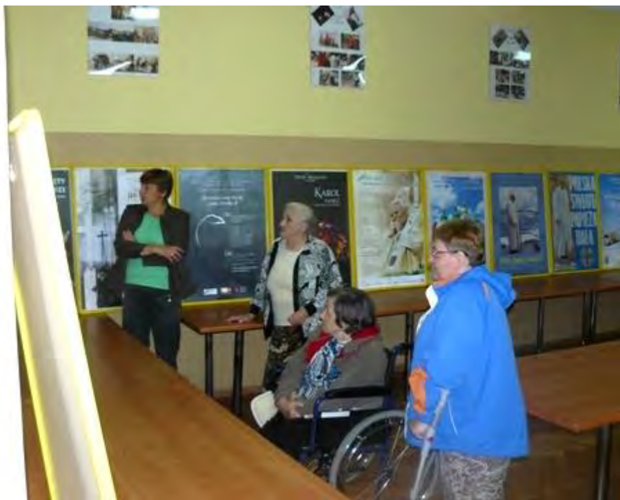
Od dnia 19 października wystawa gości w Senacie RP w Warszawie - do 27.X.2016 r.)