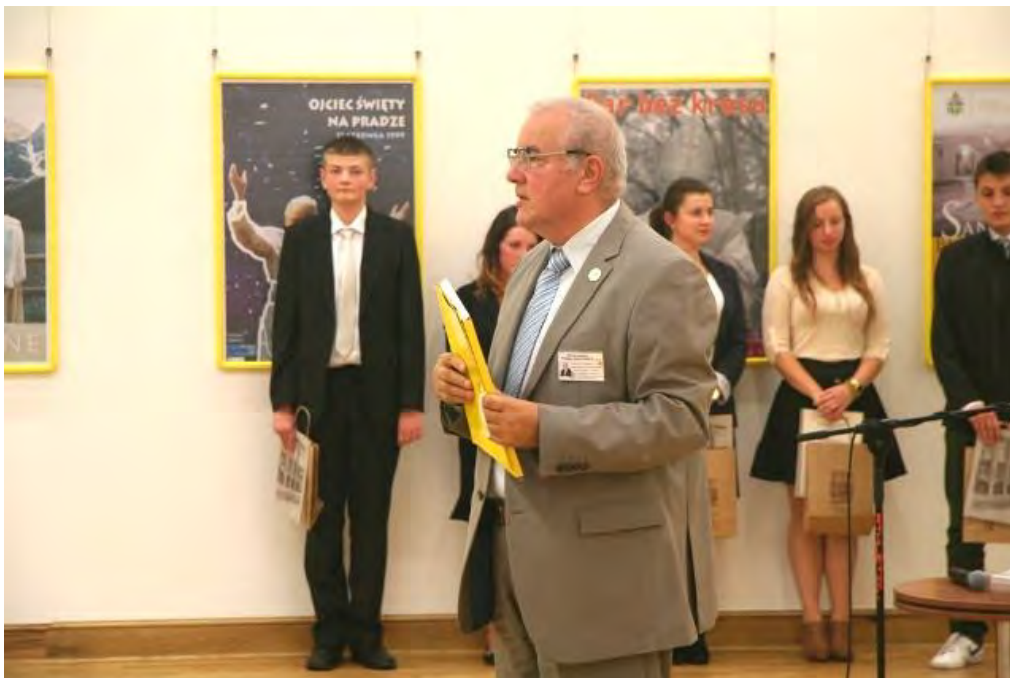
Lublin Wojewódzka Biblioteka Publiczna im. Hieronima Łopacińskiego 16. X. 2013 r. w kolejną rocznicę wybory Kard. K. Wojtyły na Papieża JPII.