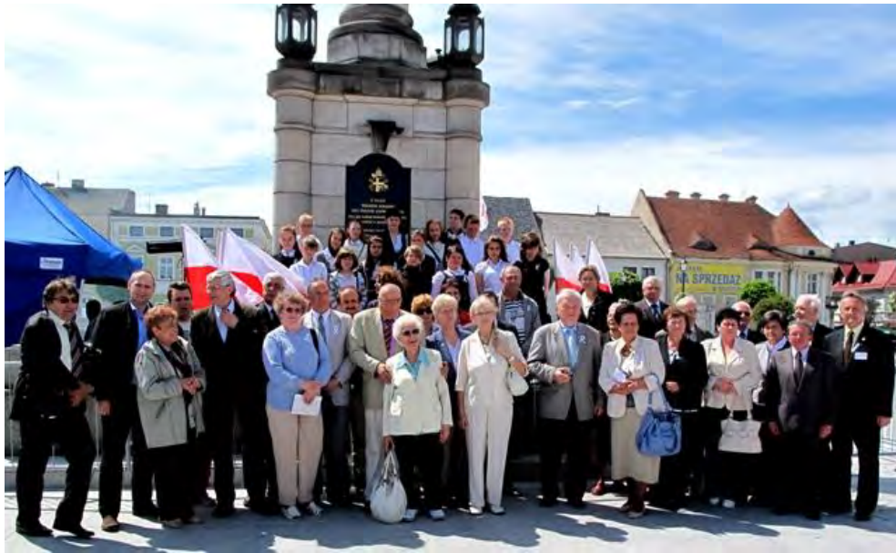
Krobia 01.06.2013 r. - przy pomniku JP II