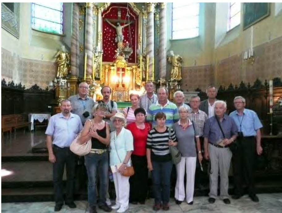
Przed kościołem pw. Św. Jana Chrzciciela w Samborze 13.09.2012 r.