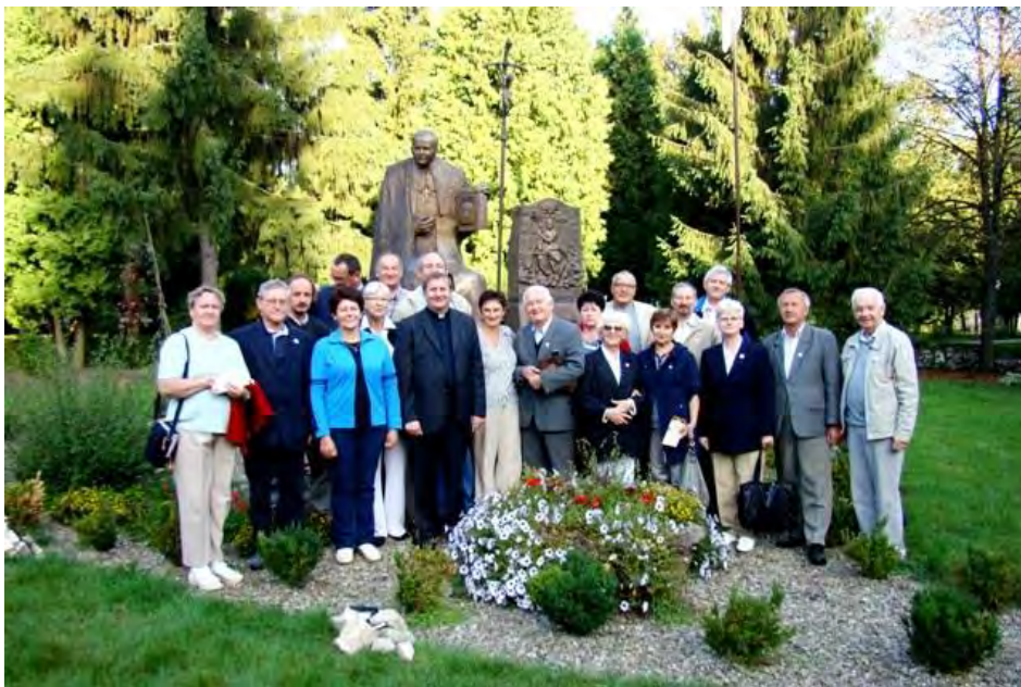
Stowarzyszenie Pamięć Jana Pawła II na Cmentarzu Orląt Lwowskich - 10.09.2012 r.