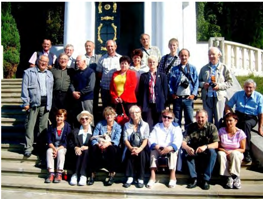
Stanisławów 11.09.2012 r. przy pomniku Boginki Kobiet - wszystkie nasze Panie