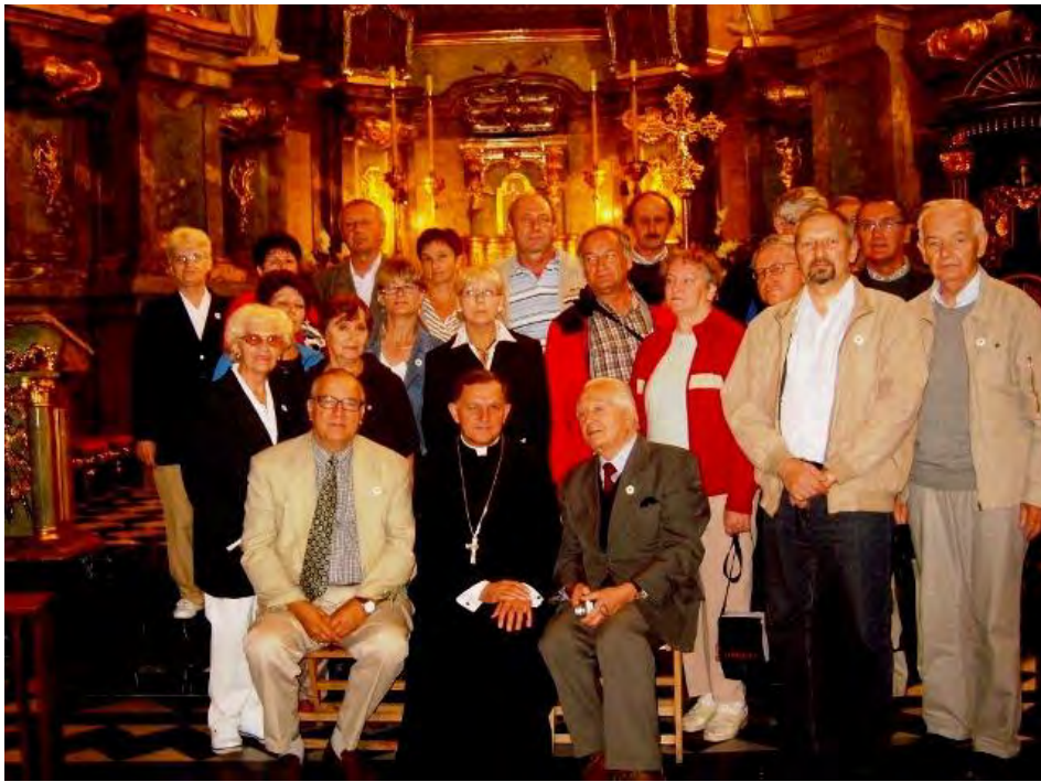
Stowarzyszenie Pamięć Jana Pawła II przy NASZYM Pomniku Bł. JP II w Lwowie Brzuchowicach ( teren Wyższego Seminarium Duchownego Metropolii Lwowskiej)