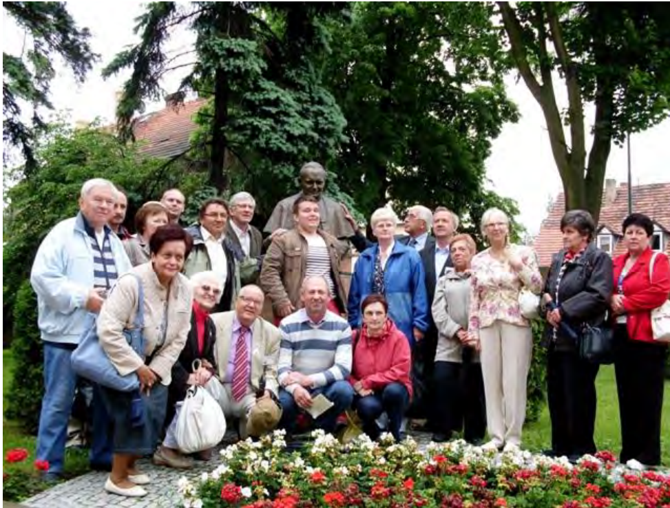
23.06.2013 r. nastąpiło poświęcenie górnego kościoła w Sanktuarium Bł. JP II w Krakowie.

Pamiętkowa widokówka wydana przez nasze Stowarzyszenie)